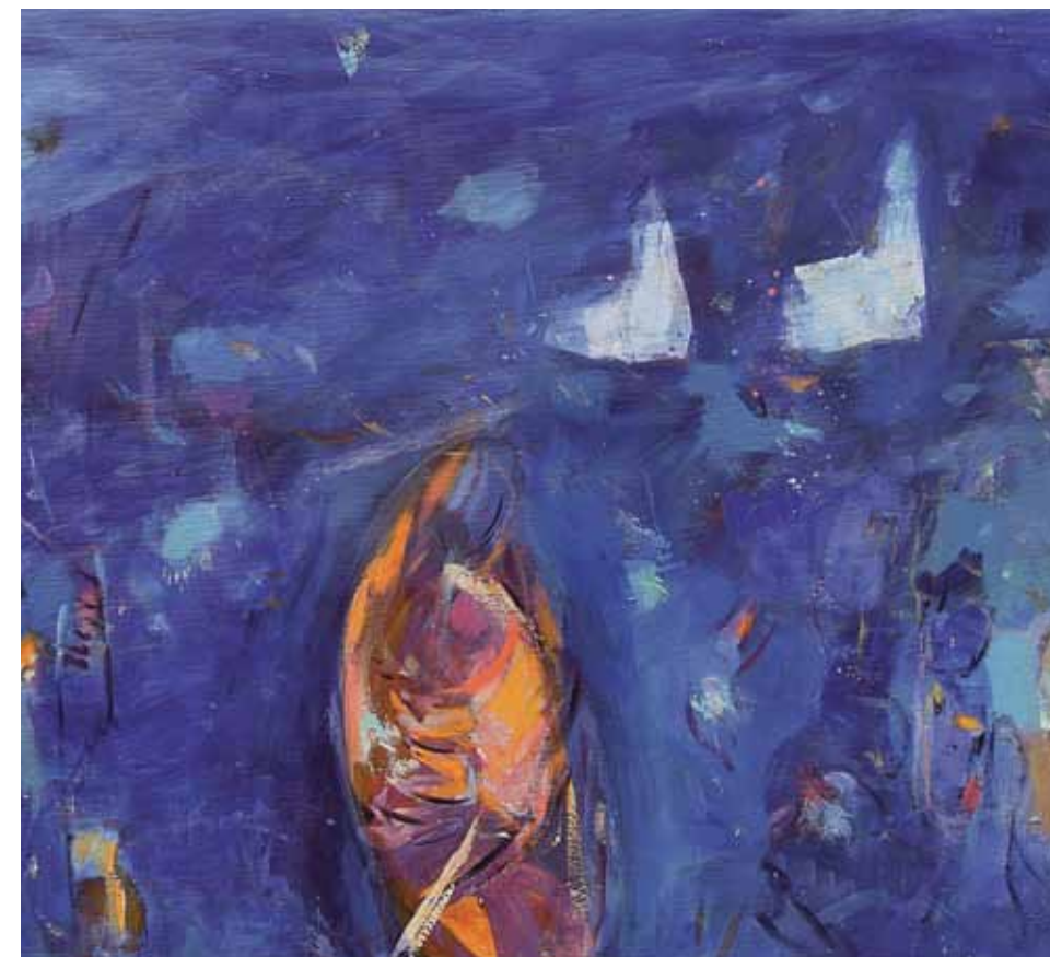
Iz ciklusa Tinska gora VII , 2019, akril na platnu, 80 cm × 120 cm, detajl