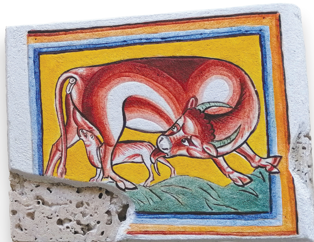
Maja Šubic, Grivarjevi otroci, 2023, freska na lehnjaku, 27 × 74 cm × 11 cm