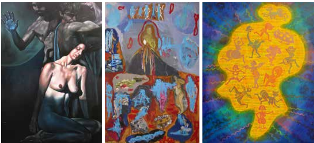
Paride Di Stefano ESCHATON III, 2015 olje na platnu 200 x 150 cm